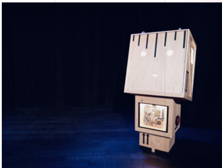
Simone - Le robot du spectacle conception de Simone Florian Guerbe voix du robot Laura Charpentier

Pour illustrer ses propos, il programme son robot lequel fait apparaître successivement trois personnages qui vivent des situations émotionnelles fortes. Jacques se revêt comme un scientifique au top de sa forme !